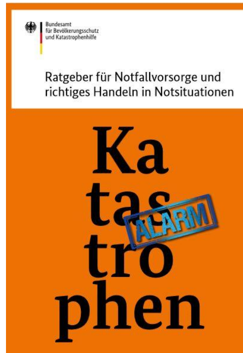
Broschüre des Bundesamts für Bevölkerungsschutz und Katastrophenhilfe

Ralf Kotte Fachbereichsleitung Bevölkerungsschutz der Stadt Leonberg